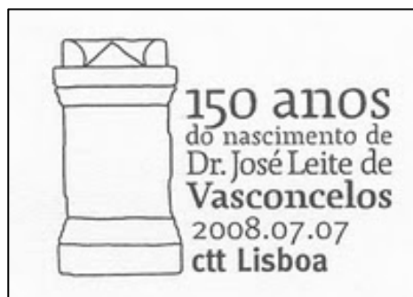
(fig.4) Carimbo Comemorativo dos 150 anos do Nascimento do Dr. José Leite Vasconcelos