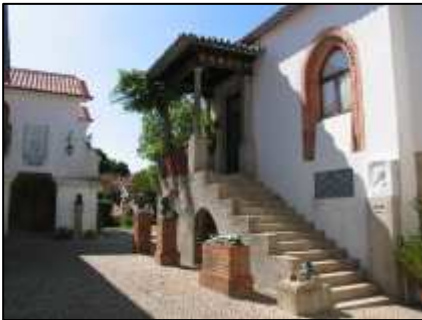
(fig. 27) Casa Museu Teixeira Lopes