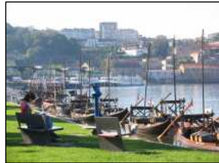
(fig.28) Cais de Gaia