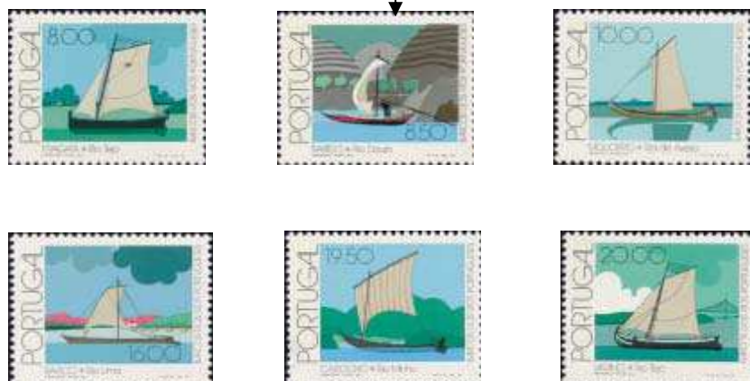
(fig.24) Barco Rabelo

Vila Nova de Gaia, é muito rica em Parques Naturais e Jardins, o que permite a todas as pessoas estarem em contacto com a natureza e os seus ecossistemas, como por exemplo o Parque Biológico, o Park&Zoo Santo Inácio a Estação Litoral da Aguda. A nível da restauração e comercio geral Gaia Vila