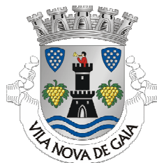
(Fig. 1) Brasão da Cidade de Vila Nova de Gaia