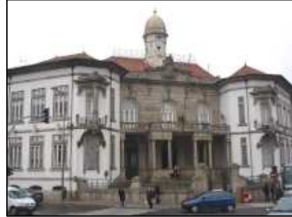
(fig. 26) Casa Barbot