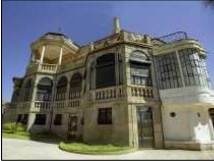
(fig.25) Câmara de V.N.Gaia

Nova de Gaia tem uma grande diversidade e com muita qualidade. É uma cidade moderna, mas preserva muito a sua tradição, pois é um marco muito importante na sua história. A Longo dos anos conseguiu conquistar uma independência e uma autonomia total, de acordo com o desenvolvimento das suas infra-estruturas sociais, culturais, recreativas e económicas.